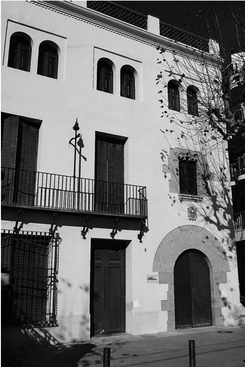
Fundació Pere Coromines a Sant Pol de Mar. Antiga casa d'estiueig de la família de Pere Coromines.