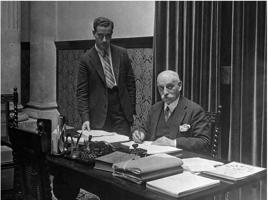
Pere Coromines, conseller de Justícia de la Generalitat (1933).