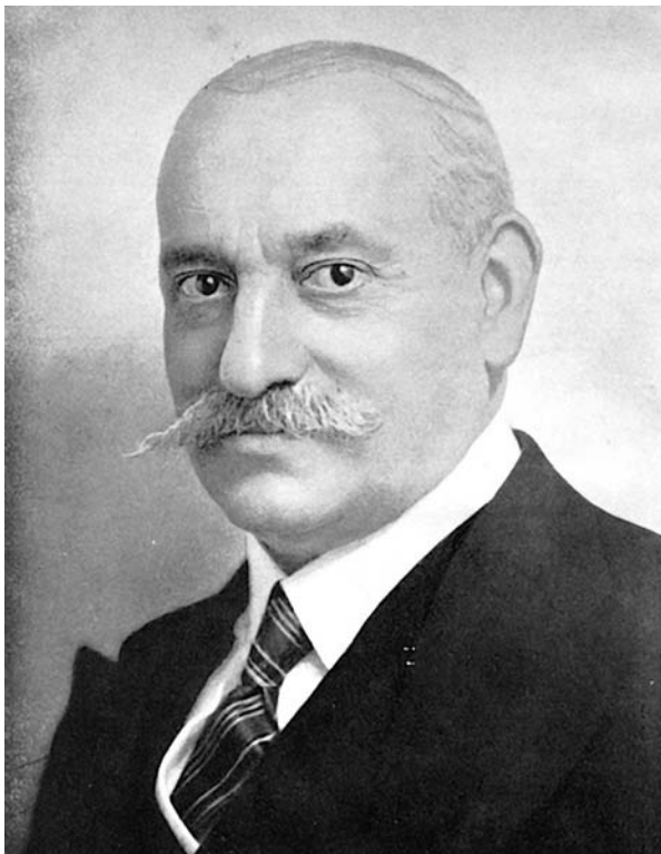
Pere Coromines en un retrat de 1930. (Ajuntament de Pineda de Mar.)