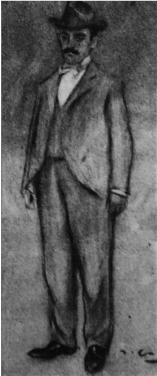
Pere Coromines segons un retrat de Ramon Casas (c. 1900). (Casa Museu Prat de la Riba de Castellterçol.)