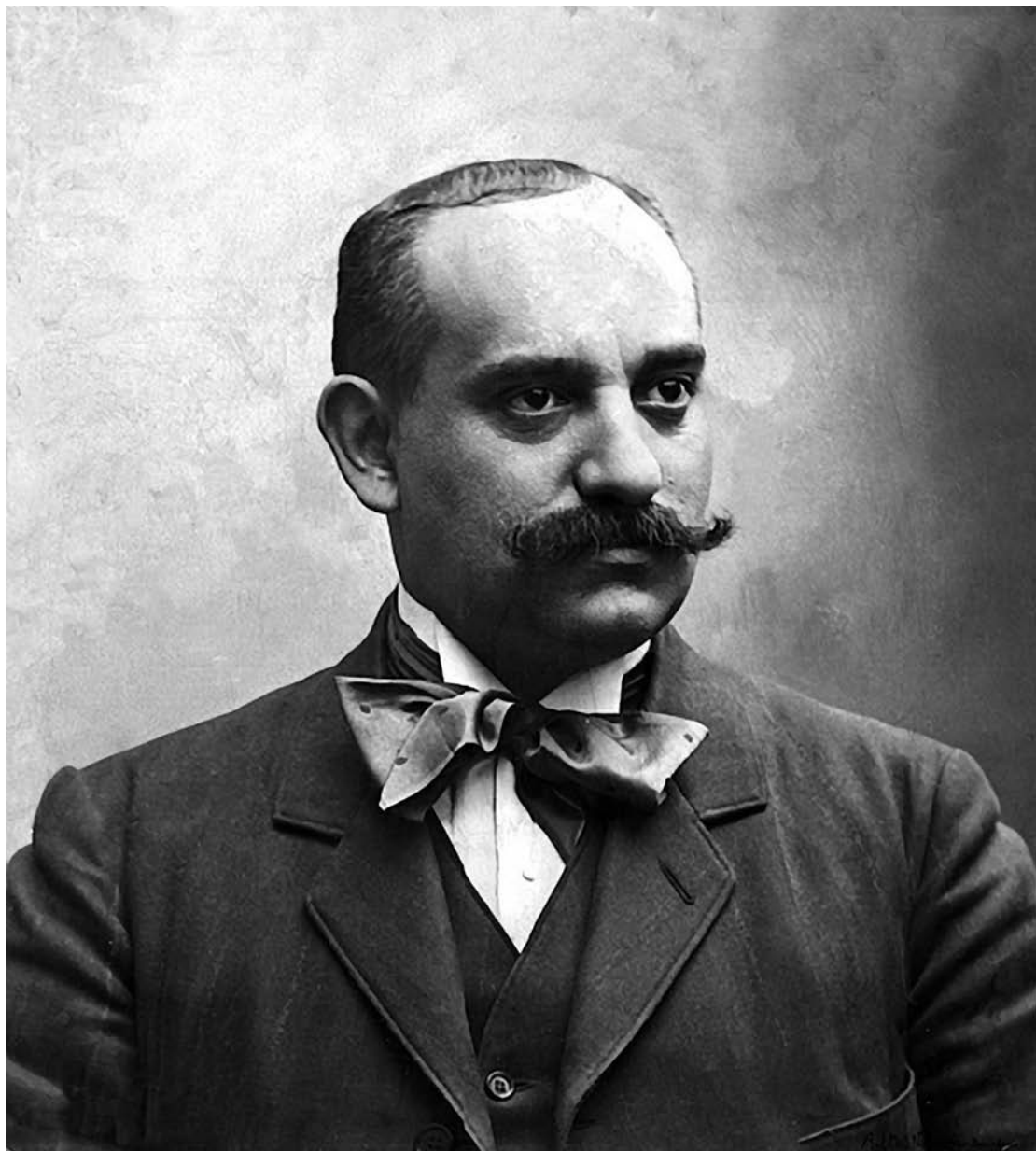
Retrat de Pere Coromines. (Fundació Pere Coromines.)