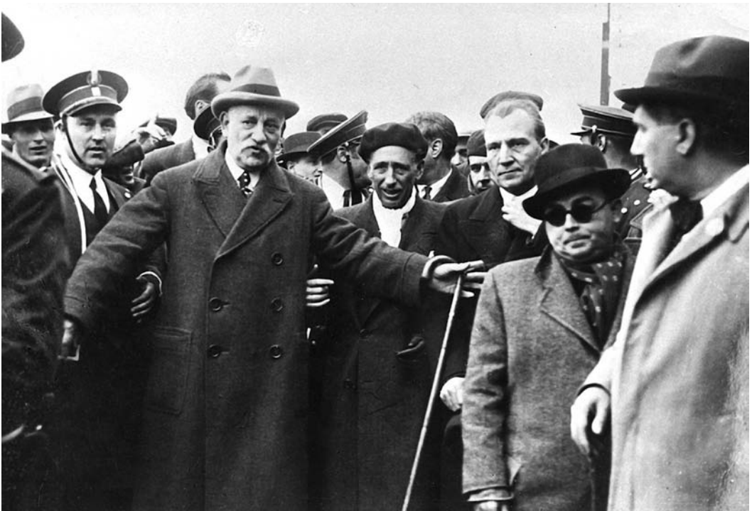
Pere Coromines i Lluís Companys (1 de març de 1936).