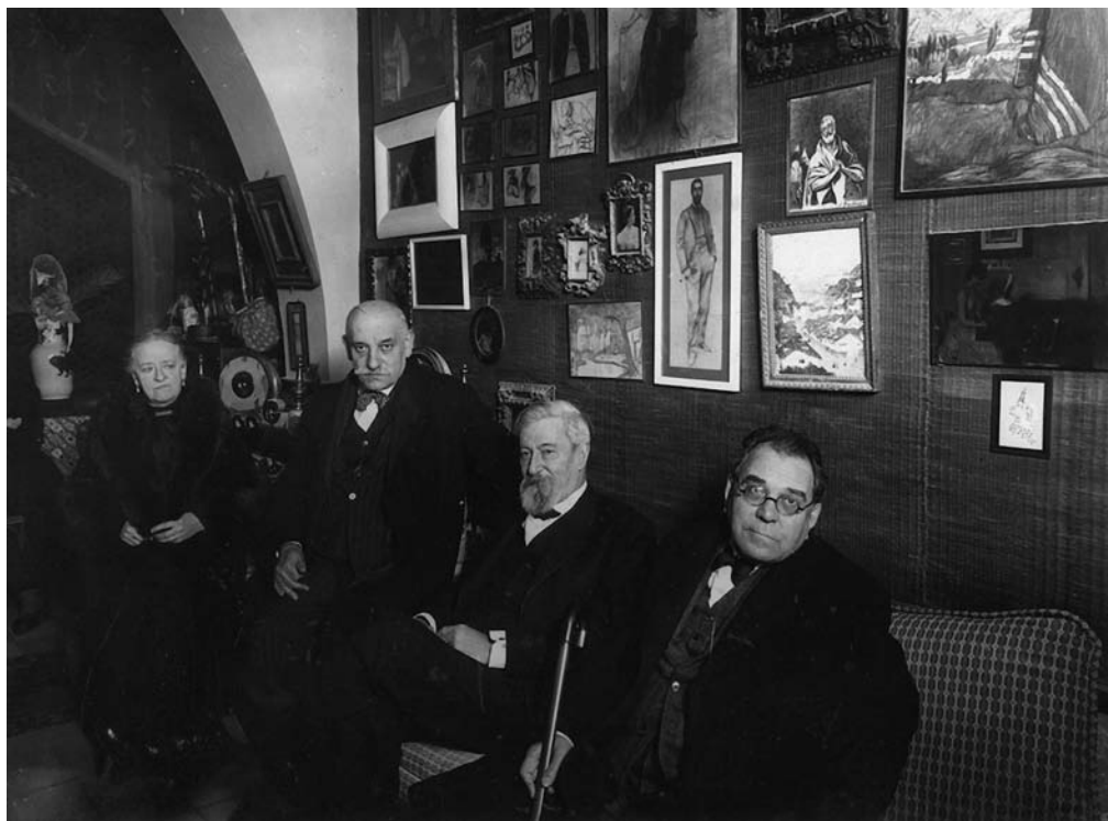
Lluïsa Denís, esposa de Santiago Rusiñol, Pere Coromines, Santiago Rusiñol i el compositor Amadeu Vives al Cau Ferrat de Sitges (24 de març de 1930). (Fundació Pere Coromines.)